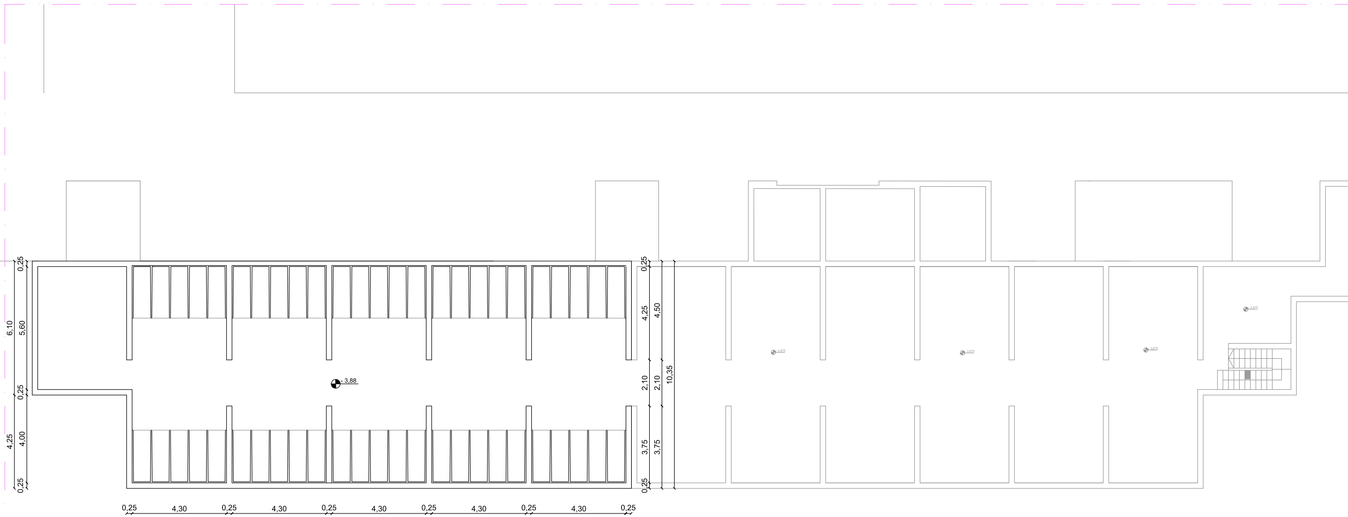
PIANTA PIANO INTERRATO Scala 1:100